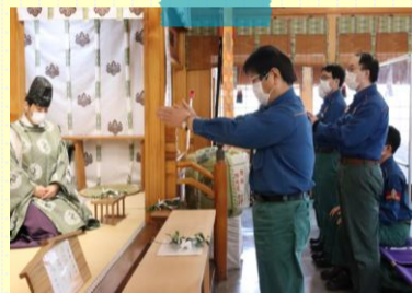
安全を祈願する下村社長