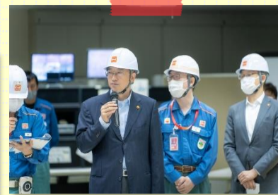
挨拶をする田董事長