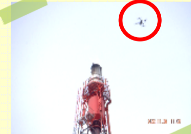
フレアスタックとドローン