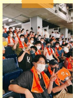
東京ドームにて応援