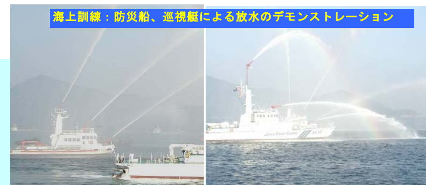
海上訓練: 防災船、巡視艇による放水のデモンストレーション

防毒マスクと防護服を装着した作業員が、漏えい範囲の確認や有害危険物質の防除作業を行う訓練も併せて実施します。