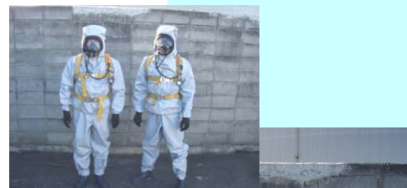
危険有害物質の防除作業に必要な防護服・空気呼吸器の装着訓練の様子