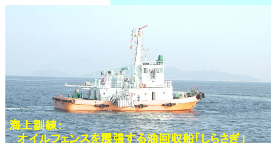
海上訓練: オイルフェンスを展開する油回収船「しらすぎ」

11月30日(火)、三菱レイヨン株式会社大竹事業所様におきまして今年度の訓練を実施します。