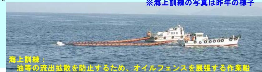
海上訓練: 油等の流出拡散を防止するため、オイルフェンスを展開する作業船