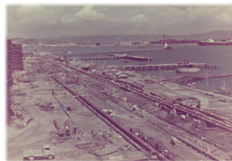
B工場 棧橋工事の風景