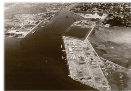
操業当時の航空写真 (左上A工場・右下B工場)

今後も所員一丸となり、安全・安定操業の継続に取り組む強い信念と決意を持ち、操業を通じて、社会へ・地域へ貢献し続けられる製油所となるよう、引続き取り組んでまいりる所存ですので、変わらぬご理解・ご支援をお願い申し上げます。