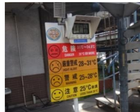
外気温・湿度による熱中症予防情報