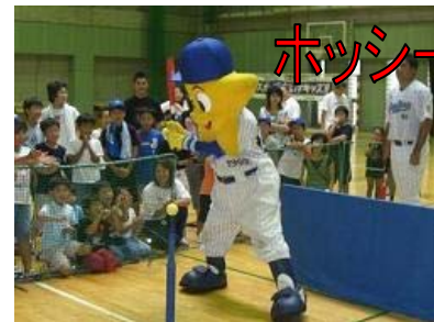
ホッシー君も参加しました!