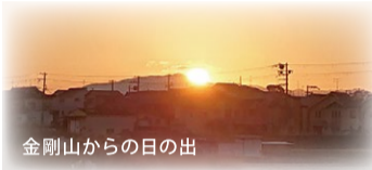
金剛山からの日の出

それを解く鍵の一つが免寸という地名です。免寸はトノキと読めるのですが、トキとは古代朝鮮語で、「迎日、日の出」の意味があり、この地は日の出の太陽を祀る聖なる地だったのです。朝日に真っ先に照らされ、夕日に最後まで輝くこの樹を見て人々は太陽神の宿る樹として崇めたことでしょう。