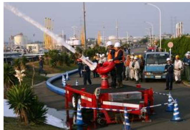
迫力のある大容量泡放射システム放水風景