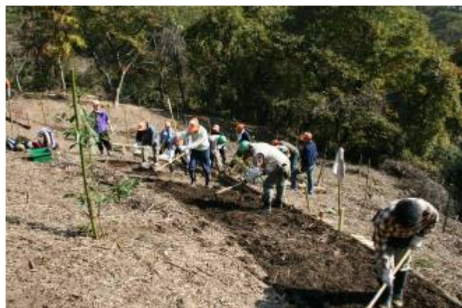
遊歩道整備も手馴れたものです。

内閣府が定める家族の週間(11月8日～11月21日)前日ということで、家族の参加を広く呼びかけ、昨年3月に植菌したキノコの収穫を小さな子どもたちと家族、