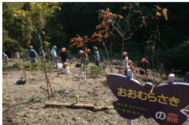
オオムラサキの餌場となる森の整備。

11月7日(土)仙台製油所および東北支店の社員、家族ならびに当社OB合わせて90名が参加し、宮城県森林インストラクター協会員25名による指導の下、「第12回宮城県ENEOSの森」森林整備活動を行いました。