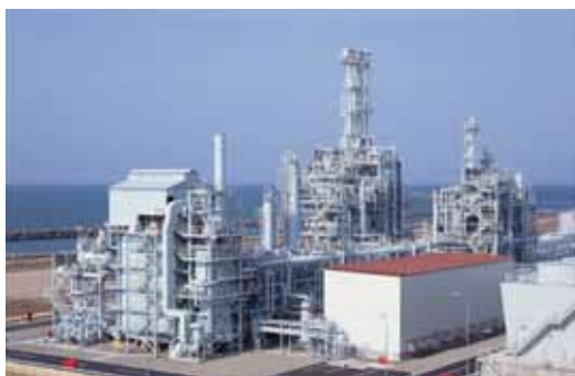
新潟に建設された 500 B/D の実証プラント