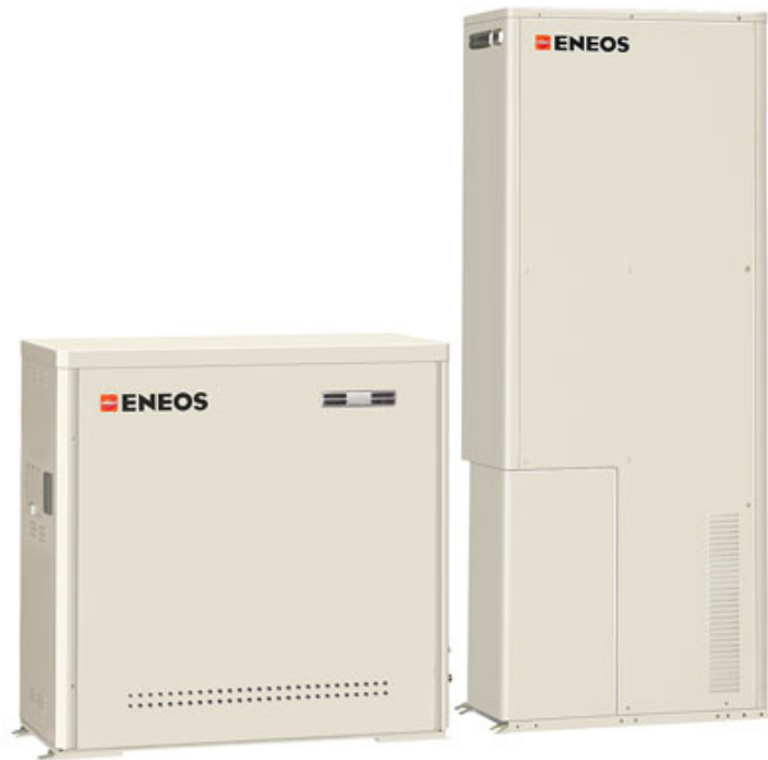
左:発電ユニット 幅1.0m 高1.0m 奥行0.45m 右:貯湯ユニット 幅0.75m 高1.9m 奥行0.44m