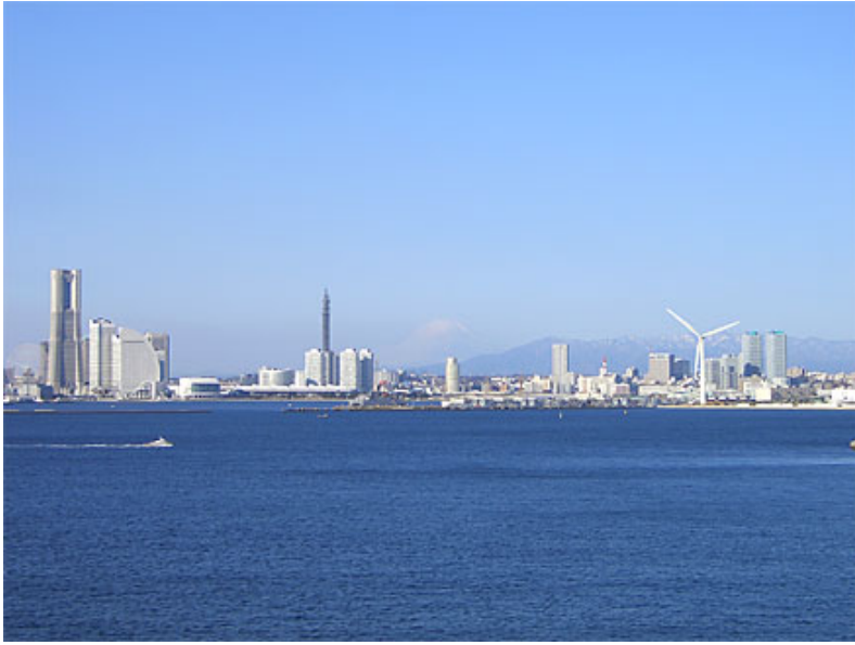
日石横浜ビル(当社関東第3支店)からも眺望可能。