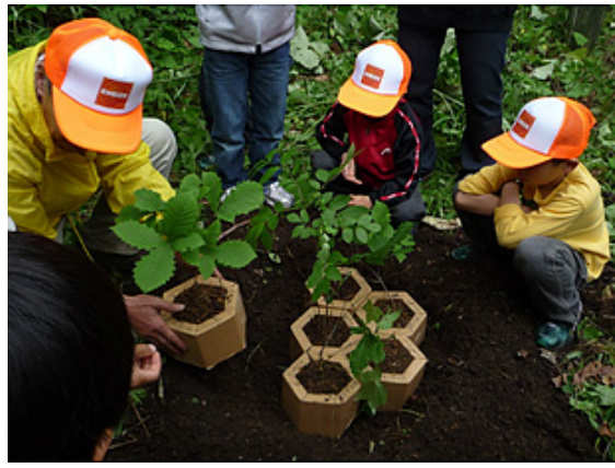
植樹の様子(北海道) 「北の森21運動の会」の指導を得て、 トドマツ植林地と広葉樹食隣地の下草刈りし、苗木を植えました。