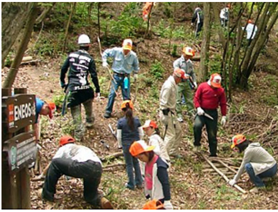
下草取り、間伐の様子(山口県) 「NPO法人・やまぐち里山人ネットワーク」の指導を得て、 定期的な取り組みである下草取りや間伐を行いました。