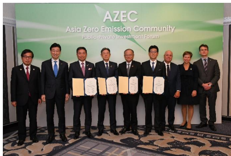
図 AZEC官民投資フォーラム

なお、3月3日、西村康稔経済産業大臣、石塚博昭NEDO理事長、豪州マクアリストアー気候変動・エネルギー補佐大臣、豪州ハイハースト駐日大使、豪州ビクトリア州政府パラス財務大臣の立ち会いの下、本グリーンイノベーション基金事業における商用化実証を進展させ、日豪間での国際的な液化水素サプライチェーン構築を進展させることに合意することの協力覚書が締結されています。